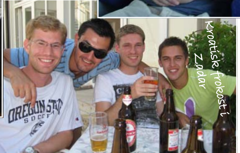
Kronisje frokost i Zadar

En mengde flere bilder er på finne på min hjemmeside ( www.makh.no ) ☺