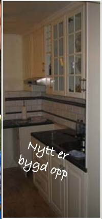
Nytt er bygd opp