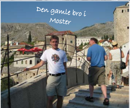
Den gamle bro i Moster