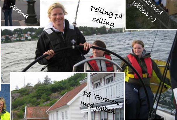
Peiling på seiling