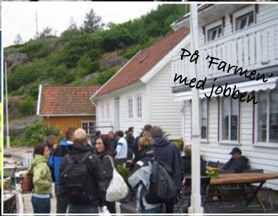
På 'Farmen' med jobben