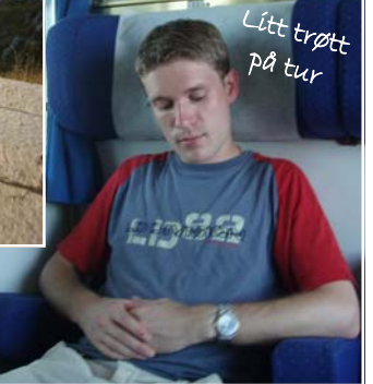
Litt trøtt på tur