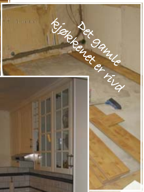
Det gamle kjølebeinet er rivd