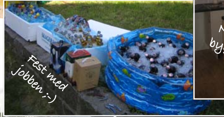
Fest med jobben;-)