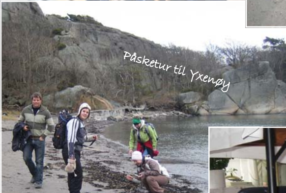
Påsketur til Xsenj