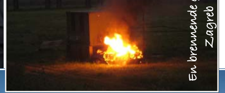
En brennende golf i Zagreb